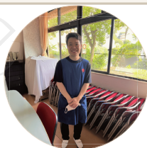
ベトナム 30代・男性

Nam điều dưỡng Việt Nam tỏa sáng tại dịch vụ Tắm tại nhà